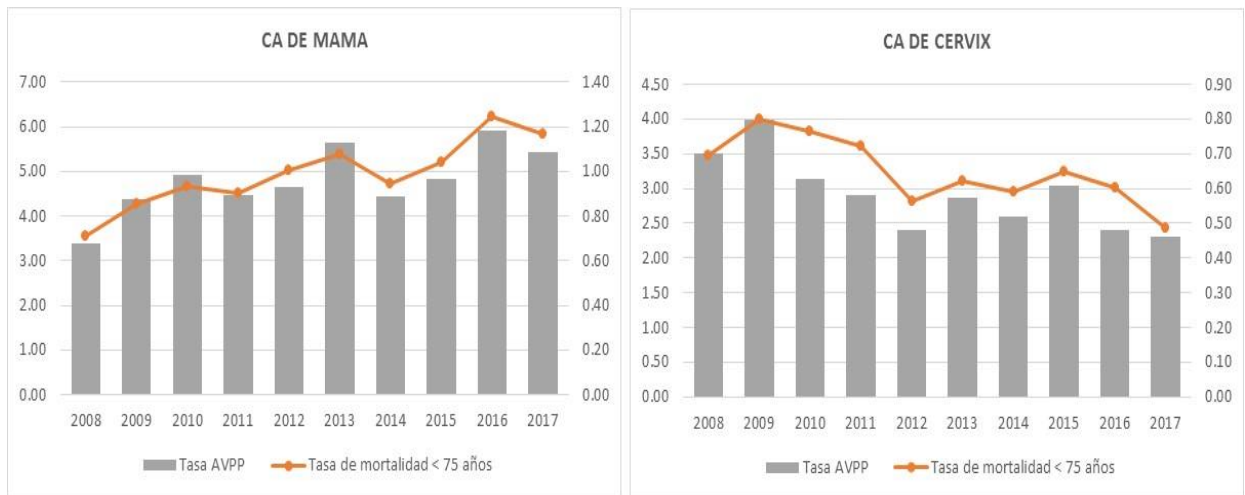
Gráfico 3. TASA DE MORTALIDAD Y DE AVPP DE CÁNCER DE MAMA Y CÉRVIX. PERÍODO 2008 – 2017