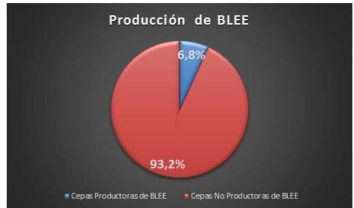
Gráfico 1: En el 6,8 % del total de las muestras analizadas se observa la producción de Betalactamasas de Espectro Extendido (BLEE)

Betalactamasas de Espectro Extendido (BLEE) (6,8 %)